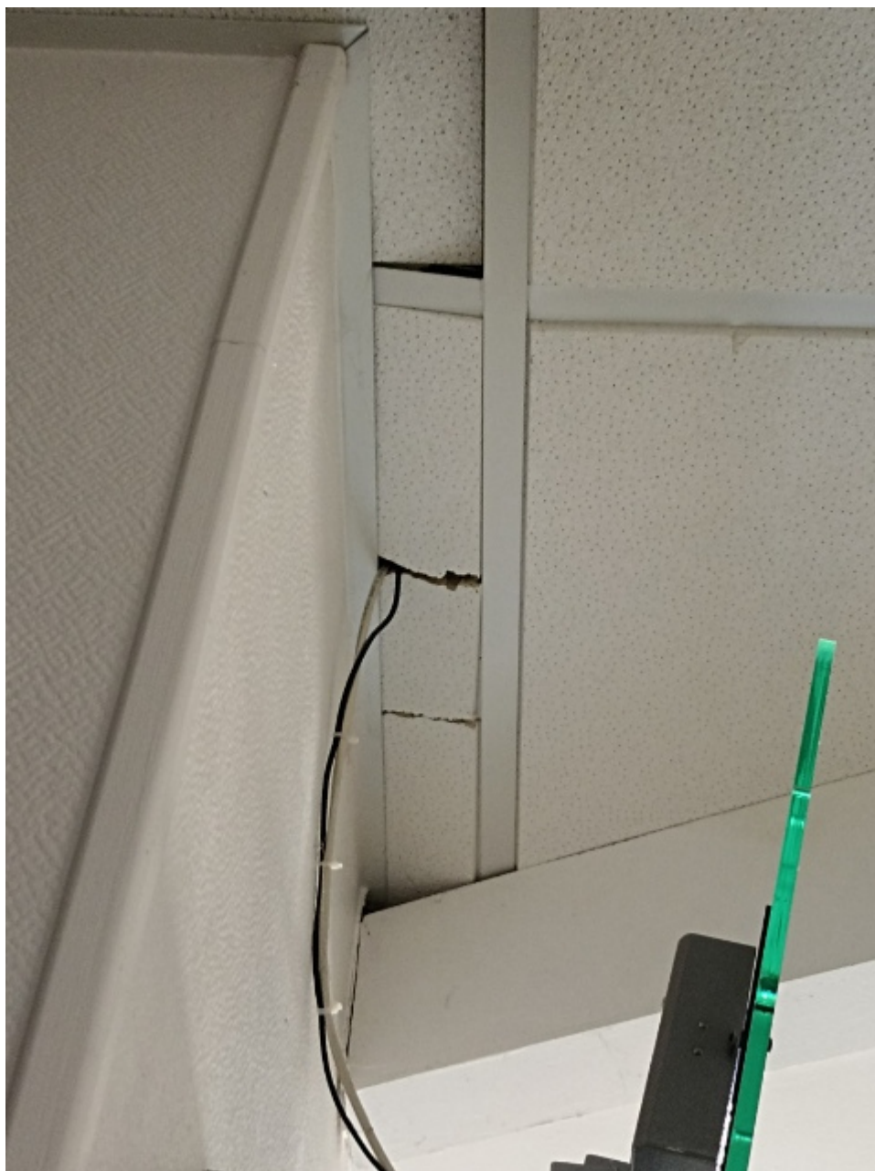
— image000000(1).JPG —